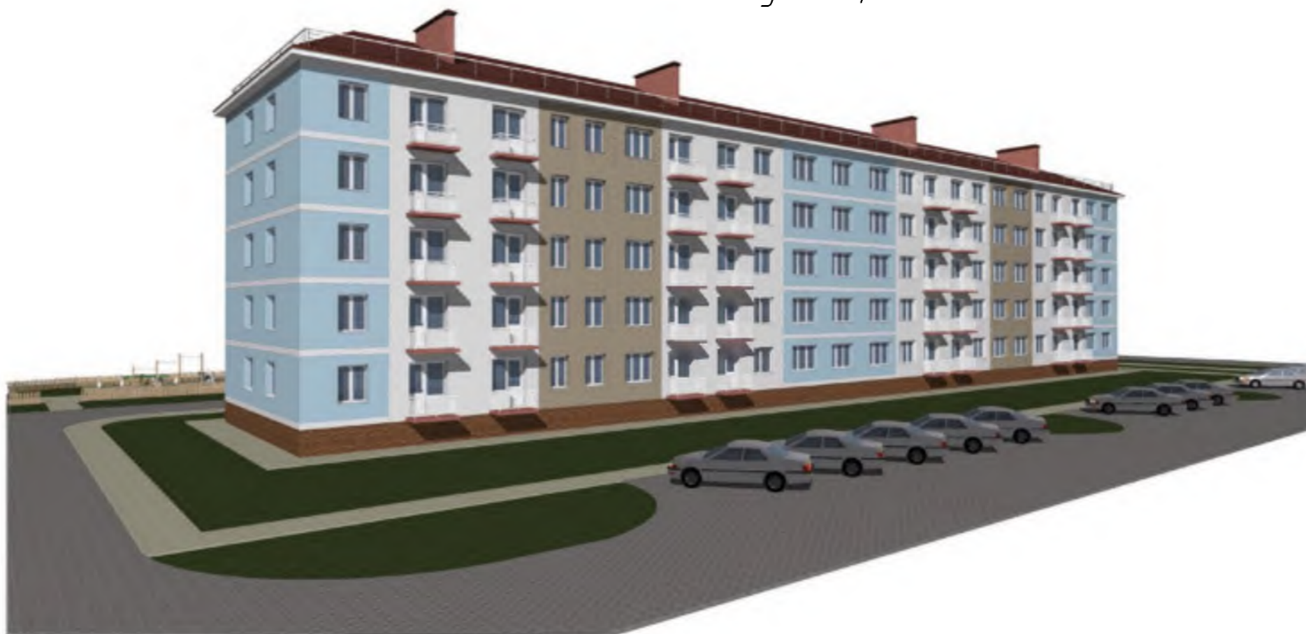
Визуализация вид №2